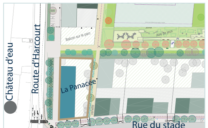
Implantation La Panacée dans le futur ÉcoQuartier